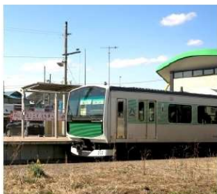
蓄电池驱动的列车 (630V)